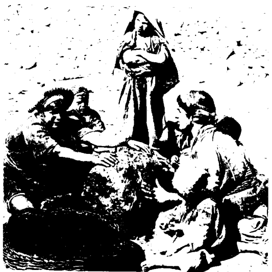
כבישת זיתים לשמן בעבודת-ידיים

אל-ג'אמעה אל-אסלאמיה מ-16 בפברואר 1934 משרטט את התמונה הבאה של הפועל הערבי: הוא מבקש עבודה, אך אינו יכול למצוא אותה; אין לו עבודה מפני שהיהודים לקחו את כל העבודה; הפלאחים מגורשים מעל אדמתם מפני שהיהודים קנו אותה מבעלי הקרקעות העשירים; הפלאחים נאלצים לנדוד לערים לבקש עבודה שאינה בנמצא עבורם. לא נותר להם בסופו של דבר אלא להיות שודדים.