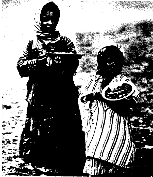
מכירת תוצרת חקלאית בשולי הדרכים

מצבם הכלכלי, אך מבלי לשנות הרבה בנוהלים ובמנהגים החקלאיים להם היו מורגלים. 3 הזירה הפוליטית הערבית נותרה אפוא בימי המנדט הבריטי בידי בעלי החזקה על הקרקעות. עם אלה נמנו סוחרים עירוניים, בעלי מקצועות חופשיים, מנהיגים, שיחים, מוח'תארים ופקידי-מימשל. העילית הזאת מנתה בסך-הכל לא יותר מאלפים בודדים, מתוך אוכלוסייה מוסלמית ונוצרית של 769,813 נפש בארץ-ישראל. האוכלוסייה הערבית הכפרית, שרובה היה מרושש, מנתה בערך שני-שלישים מכלל האוכלוסייה הערבית בארץ-ישראל בשנת 1931. 4