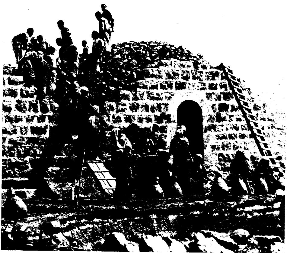
השלמת גג בבניין חדש, בהשתתפות כל בני הכפר

לא הבין הרבה כדיני-חובות, אולם — משניתנה לו ההזדמנות, הוא ניצל את החוקים והתקנות החדשים, ששירתו את עניינו. חוק הסדר הקרקעות מ-1928 נועד לקבוע גבולות לחלקות האדמה, אולם הפלאחים נמנעו מלשתף פעולה עם הממשלה בתהליך, שעיקרו מבחינתם היה העלאת אגרות רישום הקרקע והמסים עליה; קביעת הגבולות היתה חשובה לבריטים, אך לא לפלאחים. התקנות להגנת מעבדי הקרקעות מ-1929 ו-1933, גם כאשר לא יעקפו אותן בדרך-שיגרה, הגנו רק על המעמד הקטן של חקלאים-חוכרים, ולא על הקבוצה הגדולה יותר של בעלי-אדמה, שאותה עיבדו בעצמם; התקנה בעניין מאסר בעבור חוב מ-1931 הגבילה את מספר המקרים ואת תקופת המאסר על חוסר-יכולת להחזיר חוב וצימצמה את מספר בעלי-החוב העצורים, אך לא עשתה הרבה להקלת מצבם של הפלאחים בעלי החובות ארוכי-הטווח; התקנה משנת 1931 בעניין חובות של משכנתאות השאירה את החוכר על אדמתו במקרה של עיקול, אך עוררה את זעמו של בעל האדמה, שרצה לפתח את משקו או למכרו; התקנה משנת 1932 בעניין סכסוכי-קרקעות קבעה, שהישוב כפועל על הקרקע או חוכר, ללא שטר-קניין זכאים להישאר על אדמה שאינה כבעלותם, ומכך התפתחה התחושה, שתפיסת הקרקע כפועל חשובה יותר משטר הקניין של הבעלים; ועדת החקירה בעניין ערבים-חסרי-קרקעות עסקה ביישובם מחדש של פלאחים שנעקרו מאדמתם בגלל רכישת האדמה בידי יהודים, אולם הוועדה מצאה רק 899 עקורים כאלה, יישובה מחדש פחות ממאה ועוררה ציפיות אצל פלאחים רבים, שהמימשל יחזיר לידיהם אדמה שנמכרה; התקנה בעניין הלוואות בריבית קצוצה מ-1934 אסרה הלוואות בריבית מעבר ל-9 אחוזים בשנה, אולם החוק לא נאכף בפועל; הצעות החוק לחלוקת אדמות המשאע ולהגנת בעלי הקרקעות הקטנים מעולם לא הגיעו לידי חקיקה.