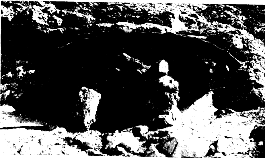
תנור (טבון) לאפייה